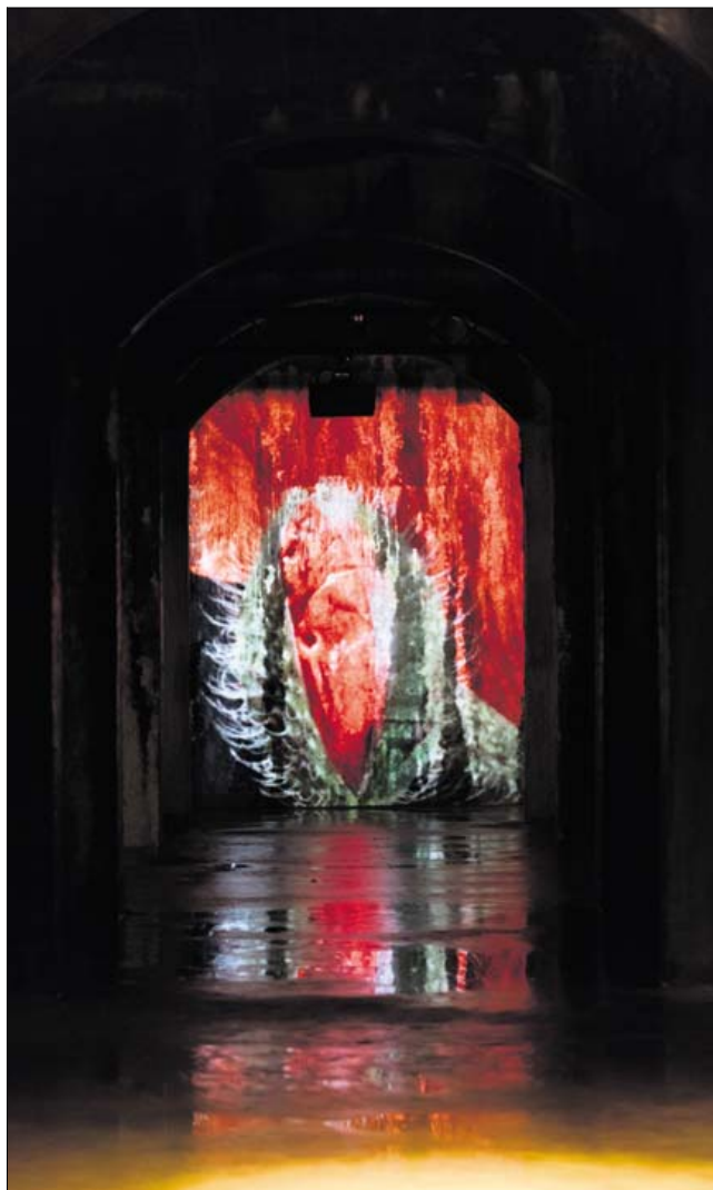
Valmuen bruges som et gennemgående symbol i udstillingen.